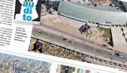
La exposición in audito sobre el mundo del sonido se inaugura mañana en la Domus coruñesa.

La exposición in audito sobre el mundo del sonido se inaugura mañana en la Domus coruñesa