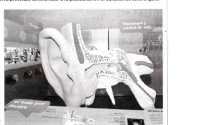
La exposición in audito de la Domus presenta 20 módulos interactivos y participativos sobre el mundo del sonido.

La Casa del Hombre acogió hasta el momento de apertura una exposición interactiva sobre el oído y su cuidado. A través de 20 módulos diferentes, in audito , la aventura de oír, pretende acercar a la población gallega a este sentido, cada vez más cuidado, pero no más cuidado.