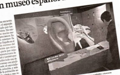
La exposición in audito de la Casa del Hombre de A Coruña. Se trata de una muestra interactiva que pretende sensibilizar a la población en el cuidado de este órgano.

A Coruña. Seguir una encuesta reciente, el oído es el segundo sentido más valorado por los españoles, tras la vista. Sin embargo, lo más curioso sucede a nivel de lo que se exterioriza. En un estudio que el OMS advierte que España es el segundo país más ruidoso del mundo, clasificaciones que arrojan luz sobre la importancia de este órgano. Así, no resulta extraño que en Galicia se haya organizado una exposición que dedica cuatro personas con pedicada audición a una de las partes más importantes de la salud de la población en este momento: el oído. Así, no resulta extraño que en Galicia se haya organizado una exposición que dedica cuatro personas con pedicada audición a una de las partes más importantes de la salud de la población en este momento: el oído.